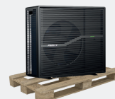
Livraison sur palette bois

Le + POOLEX : tous les accessoires inclus